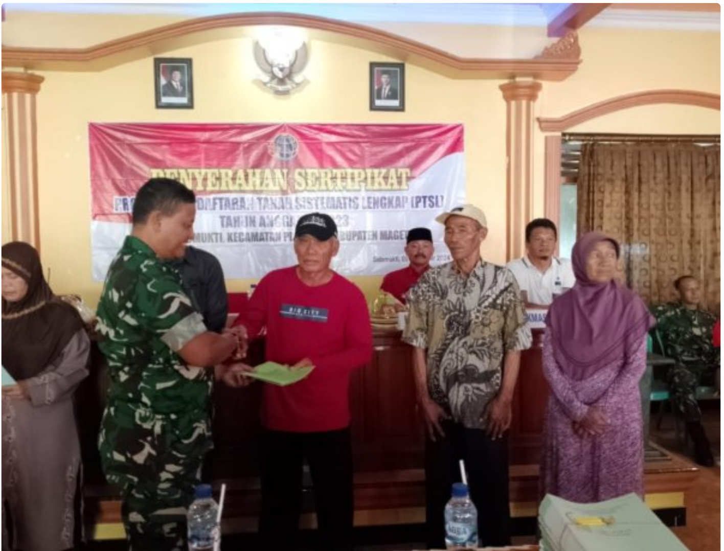
Danramil 0804/02 Plaosan Hadiri Penyerahan Sertifikat Program Pendaftaran Tanah Sistematis Lengkap (PTSL) Desa Sidomukti

PLAOSAN. - Desa Sidomukti melalui Badan Pertanahan Nasional (BPN) melakukan penyerahan Sertifikat Tanah Program Pendaftaran Tanah Sistematis