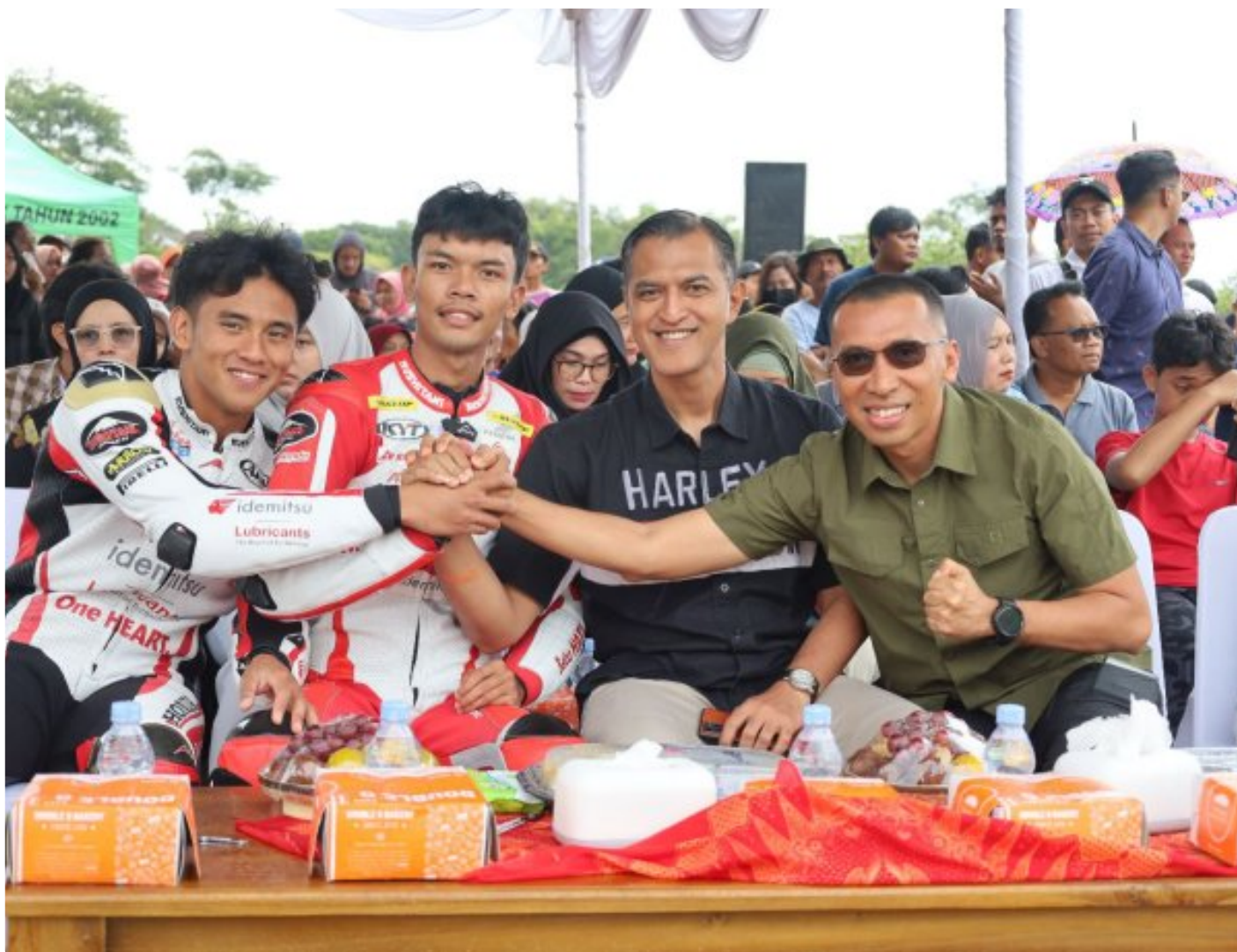
Dandim 0804/Magetan Hadiri Undangan Tinjau Sirkuit Magetan