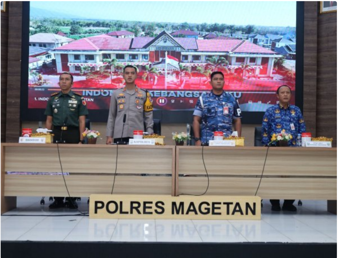
Dandim 0804/Magetan Hadiri Rakor Lintas Sektoral kesiapan operasi lilin 2024

Magetan. – Guna meningkatkan Sinergitas dalam rangka kesiapan operasi lilin 2024 pengamanan Hari Raya Natal 2024 dan Tahun Baru 2025 di wilayah Kabupaten Magetan yang aman dan kondusif.